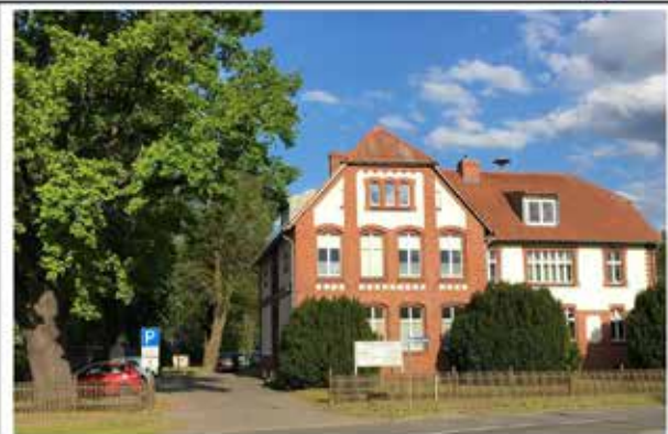
Heute ist es das Ärztehaus „An der Eiche“. 2010 wurde das Haus behindertengerecht umgestaltet.