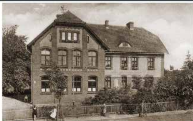
Von 1904 bis 1945 war in diesem Gebäude die Briesener Schule. Nach dem Wiederaufbau 1954 wurde daraus das Landambulatorium.