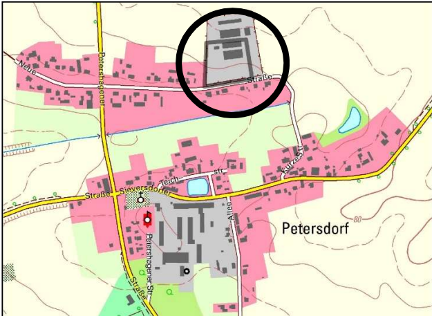
Übersichtsplan mit Geltungsbereich von der 4. Änderung des Flächennutzungsplans Jacobsdorf, Ortsteil Petersdorf sowie vom Bebauungsplan „Reitsport und Pferdehaltung“

Ein Antrag nach § 47 Verwaltungsgerichtsordnung ist unzulässig, soweit mit ihm Einwendungen gemacht werden, die vom Antragsteller im Rahmen der Auslegung nicht oder verspätet geltend gemacht wurden, aber hätten geltend gemacht werden können.