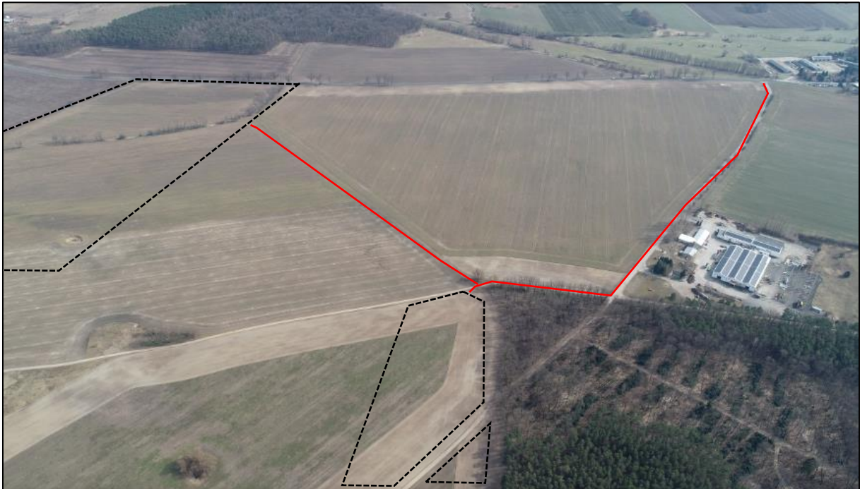
Abbildung 3: Erschließung Planteile 2 und 4 (Geltungsbereich schwarz skizziert)

In diesem Zusammenhang ist es selbstredend, dass die dazu notwendigen Pacht- und Nutzungsverträge vorliegen und eventuelle Baulasten vor dem Satzungsbeschluss eingetragen werden.