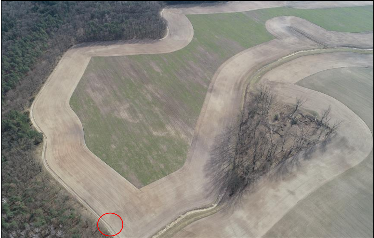
Abbildung 1: Erschließung Planteil 1

Die Erschließung des Planteil 1 erfolgt ausgehend des nördlich verlaufenden Wirtschaftsweges.