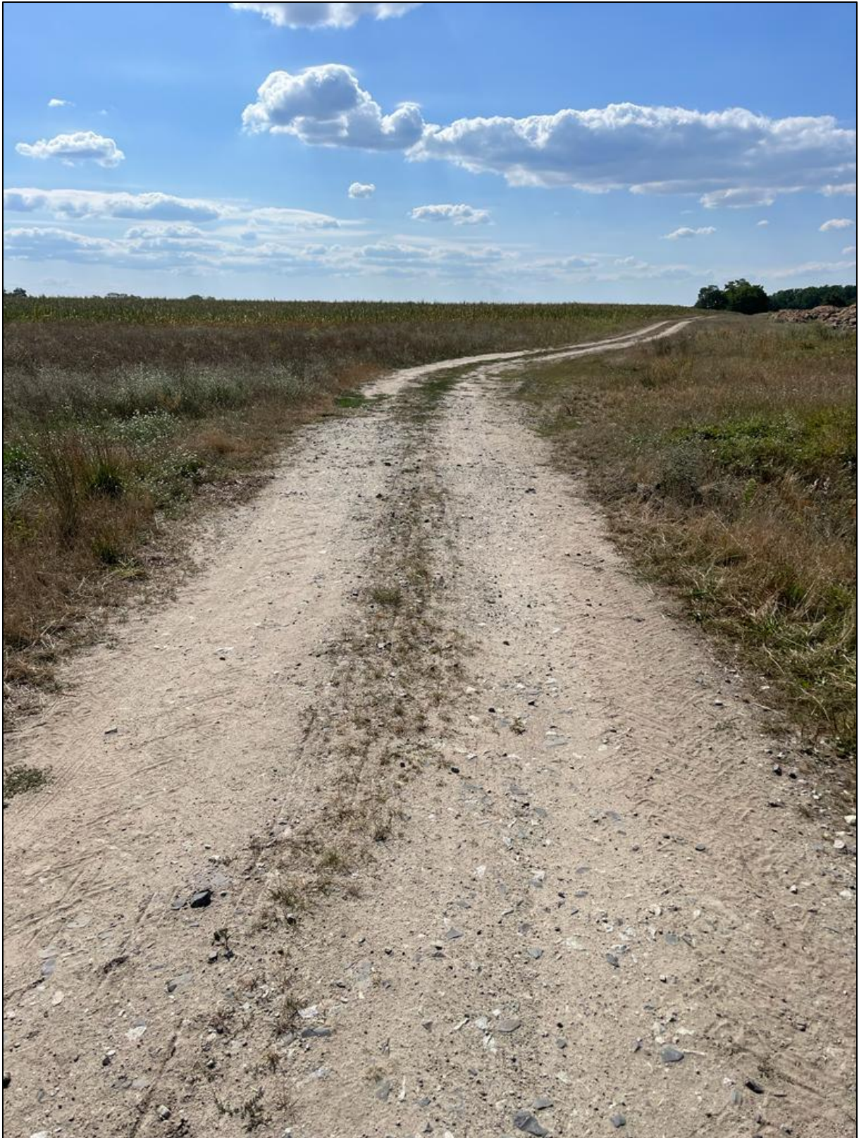
Abbildung 2: Erschließung des Planteil 1 über einen bestehenden Wirtschaftsweg

Die Erschließung des Planteil 1 erfolgt entsprechend der nachstehenden Abbildung über das Flurstück 292 als öffentlich gewidmeter Wirtschaftsweg.