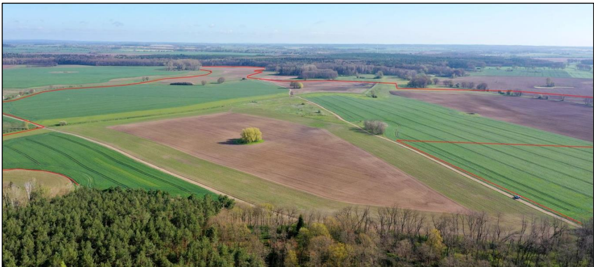
Abbildung 1: Drohnenbefliegung des Planungsraumes, Oekoplan Halle

Das anstehende Gelände steigt von Süden nach Norden stetig von Höhen um 55 m NHN auf bis zu 59 m NHN an. Das Relief ist als eben zu bewerten. Strukturgebende Gehölze, wie Baumreihen oder Gehölzgruppen fehlen fast vollständig. Zwei Kleingewässer mit einem hohen Eutrophierungsgrad verteilen sich auf die Planteile 1 und 2. Nationale und europäische Schutzgebiete sind auf Grund des großen Abstandes nicht betroffen.