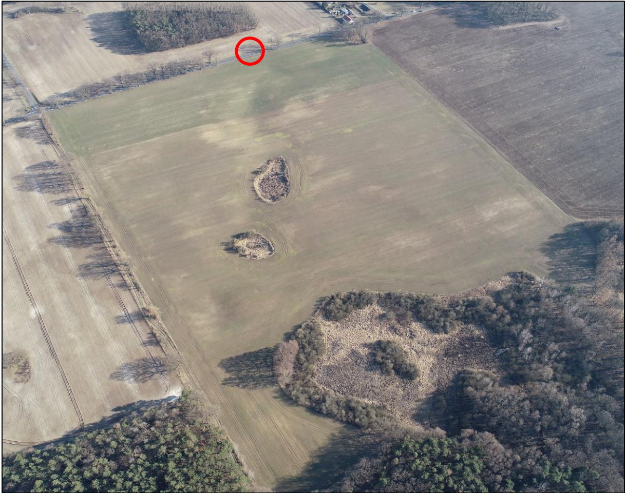
Abbildung 4: Erschließung Planteil 1 (Zufahrt rot markiert)