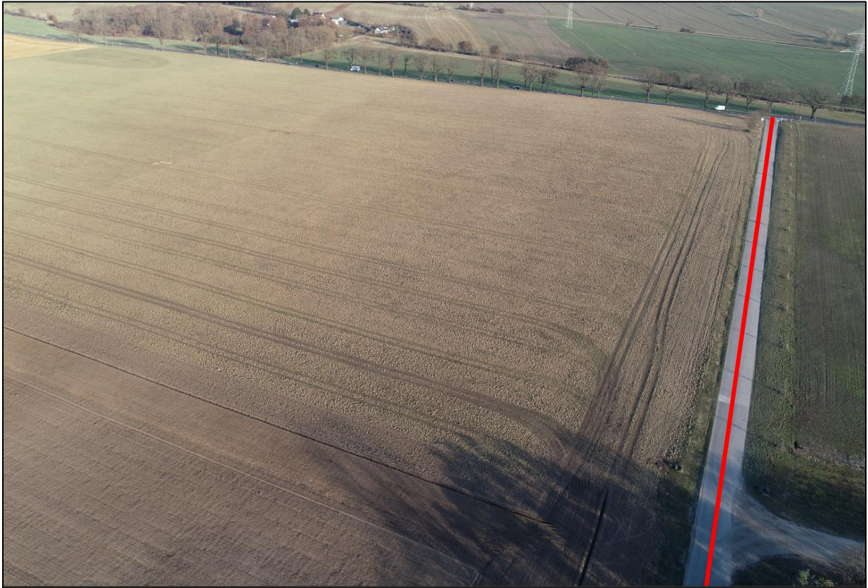
Abbildung 5: Erschließungsstraße südwestlich des Planteil 2