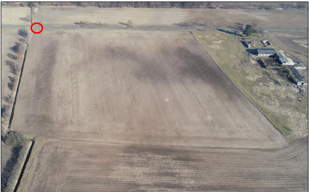
Abbildung 6: Bereich der geplanten Zufahrt zum Planteil 3