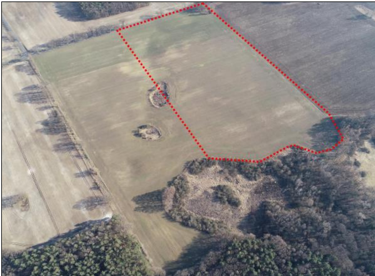
Abbildung 1: Drohnenbefliegung des Planteil 1, SUNfarming GmbH, März 2021

Die nördliche Grenze bildet ein umfangreicher Biotopkomplex aus Wald und Feuchtbiotopen mit einer hervorgehobenen Bedeutung für den Arten- und Biotopschutz. Das anstehende Gelände fällt ausgehend von einem zentral gelegenen Plateau mit Höhen um 62 m NHN auf bis zu 58 m NHN im Norden ab. Fließgewässer, Gehölze und gesetzlich geschützte Biotope werden nicht überplant. Ein kleines isoliertes Kleingewässer im Nordosten ist in seiner Bedeutung als Lebensraum von besonderer Bedeutung.