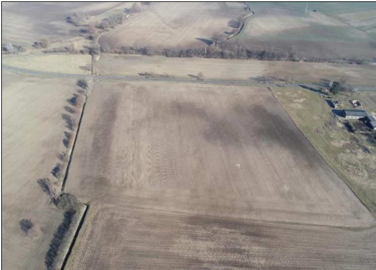
Abbildung 3: Drohnenbefliegung des Planteil 3, SUNfarming GmbH, März 2021

Nationale und europäische Schutzgebiete sind auf Grund des großen Abstandes nicht betroffen.