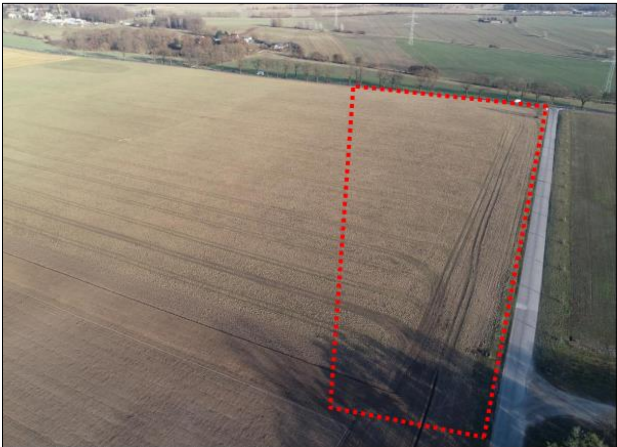
Abbildung 2: Drohnenbefliegung des Planteil 2, SUNfarming GmbH, März 2021

Der Planungsraum ist gehölzfrei und darüber hinaus werden keine gesetzlich geschützten Biotope überplant. Die südliche Grenze bildet eine parallel zu Landesstraße verlaufende Baumreihe. Vorbelastungen bestehen an diesem Standort durch eine vorhandene Tierhaltungsanlage im Nordwesten. Das anstehende Gelände ist mit Höhen um 67 m NHN DHHN 2016 sehr eben.